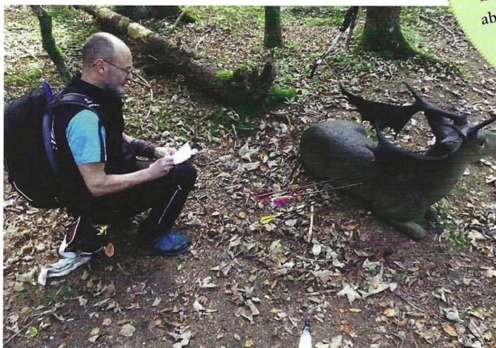
Mit Pfeilen durchlöchert: den künstlichen Damhirsch stört das nicht im Geringsten