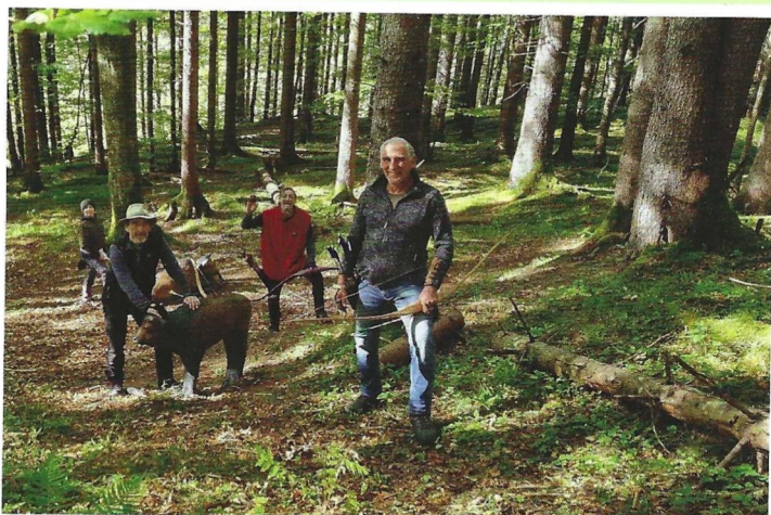
Das Team der Isarwinkler Bogenschützen ist eine eingeschworene Gemeinschaft

Groß geschrieben wird bei den Isarwinkler Bogenschützen die Jugendarbeit. Drei Jugendtrainer betreuen die Kinder und Jugendlichen zwischen 8 und 16 Jahren mit Kompetenz und Begeisterung für den Bogensport. „Der Schwerpunkt liegt auf dem intuitiven Bogentraining. Dabei wird sich zunächst auf das Ziel fokussiert und Pfeil und Bogen „unterbewusst“ in die richtige Position gebracht“, erklärt der Vorstand. Durch derartige Übungen wird der Bewegungsablauf optimiert und im Unterbewusstsein abgespeichert: Ein Garant für zielgenaue Schüsse. Wer jetzt Lust bekommen hat, das Bogenschießen einmal unverbindlich auszuprobieren, ist herzlich zum Schnuppertraining eingeladen. Jugendliche können bis zu dreimal kostenlos am Training teilnehmen. Für Erwachsene bietet der Verein jährlich einen speziellen „Schnuppertag“ an. In diesem Jahr findet er am 28. September statt. Eine