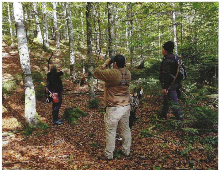
Die Isarwinkler Bogenschützen richten auch regelmäßige Turniere auf ihrem Gelände aus

mischen Tierwelt nachempfunden. Geschossen wird auf Tierattrappen aus einem speziellen weichen Kunststoff. Mit Schafwolle gefüllte Jute-