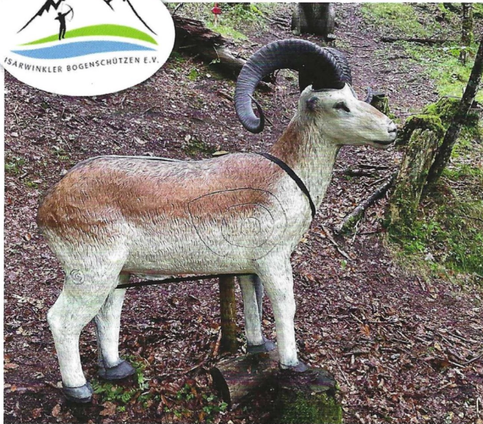
Täuschend echt, aber aus Kunststoff: der Steinbock wartet auf zielsichere Bogenschützen